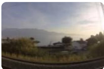
Vidéo par Emmanuel Ravalet

Du même auteur - Voir toutes ses publications