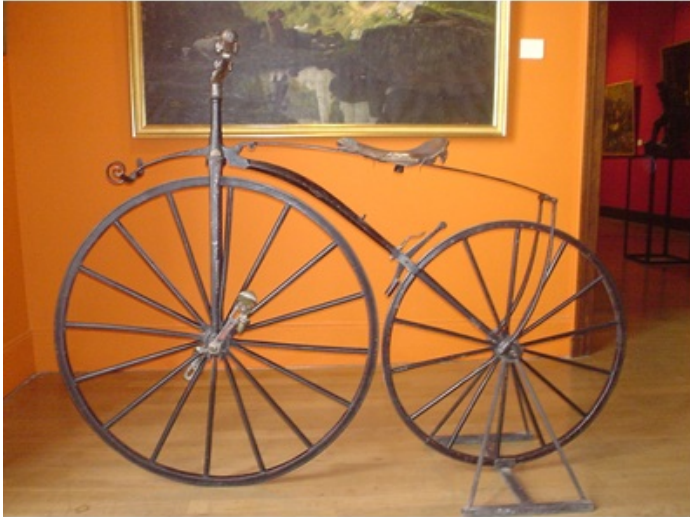
Vélocipède de Michaux (Musée de Bar-le-Duc, France, 2009)

préhistoriques. Ou ce sera devenu un divertissement folklorique comme le cheval, qui, pourtant, symbole noble de la maîtrise du vivant par l'homme, a forgé l'histoire. Et l'automobile, cet emblème de l'ère industrielle, ne sera plus le centre de gravité de l'économie et de la société qui s'est déjà réorienté vers les technologies numériques. Mais comment se déplacera-t-on dans le futur ?