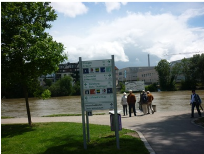
Des itinéraires pour les vélos (Ulm, Allemagne, 2011)