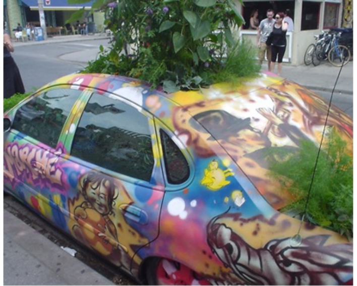
Automobile « jardin » (Toronto, Canada, 2012)

Avant de répondre, définissons bien ce dont nous parlons : l'automobile est la combinaison d'une technologie (véhicule routier à moteur), et d'un mode d'exploitation fondé sur la propriété privée du véhicule par son utilisateur. Il y a d'autres véhicules routiers à moteur (motocycle, autobus, camion), et d'autres modes d'exploitation de la voiture (taxi, autopartage), certes utilisant des automobiles, mais en plus petit nombre. En fait, l'automobile est devenu un système 2 , intégrant un secteur économique majeur, des services adaptés, l'organisation de l'espace en fonction de l'accès automobile, une place centrale dans la vie et le budget des ménages, le rite de passage du permis, le marquage du statut social, et une position de choix dans l'imaginaire collectif. Érigée en mode de vie, l'automobile a ainsi dominé la mobilité aux États-Unis dès les années 1920, en Europe occidentale depuis les années 1950, puis successivement dans les autres parties du monde 3 .