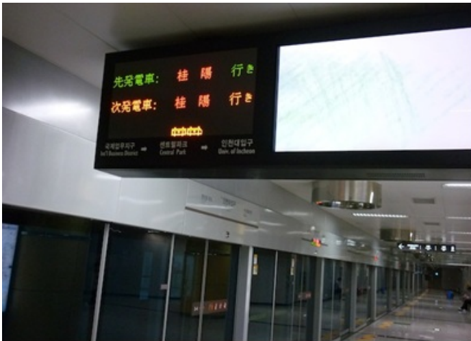
Transports publics de qualité (Séoul, Corée, 2011)