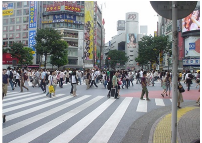
La marche favorisée (Tokyo, Japon, 2006)