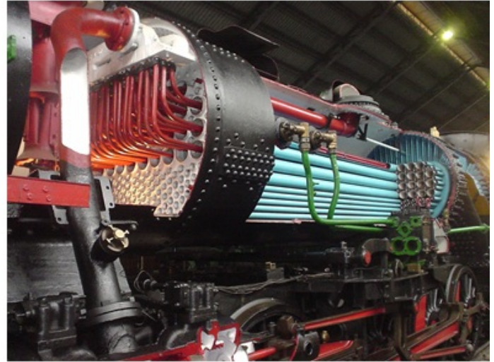
Locomotive à vapeur (Museo del ferrocarril, Madrid, Espagne, 2012)

L'histoire des transports procède plus par empilement et juxtaposition de technologies, que par remplacement radical d'une technologie par une autre. Après avoir tracé des sentiers, et assemblé des bateaux, l'homme a domestiqué le cheval, inventé la roue, puis construit des routes. Cette construction a repris en Europe au XVII e siècle, permettant à l'aristocratie 4 , puis à la bourgeoisie de rouler en voiture. Le XIX e a vu une série d'inventions : la draisienne, le chemin de fer, le macadam, l'omnibus, le tramway, le moteur à combustion interne, la bicyclette, l'automobile, le pneumatique. Au XX e siècle, les différents moyens de transport ont coexisté, et se sont améliorés en cumulant les innovations, pour aboutir au système de mobilité complexe que nous connaissons aujourd'hui. Et ce mouvement se poursuit : les types de matériels anciens roulent toujours, et il s'y ajoute des couches d'information, de modes d'exploitation, de services qui, progressivement, finissent par changer la nature de l'objet. L'automobile du XXI e siècle n'est plus celle du XIX e siècle, mais reste une pièce majeure de la mobilité.