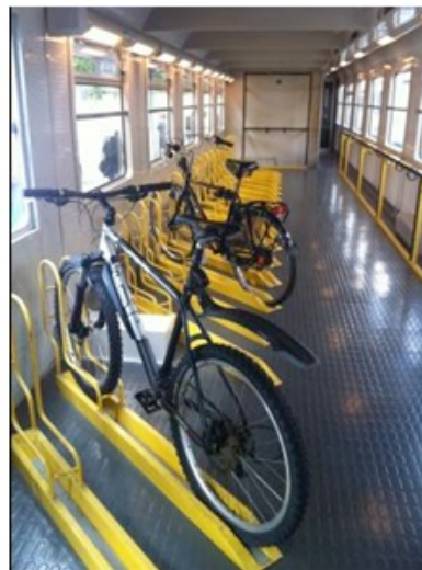
L'intermodalité organisée (Interloire, France, 2014)

Il est possible d'améliorer l'efficacité de ces modes alternatifs. La marche devrait être favorisée en libérant l'environnement urbain des nuisances automobiles, en recentrant les projets urbains sur le piéton 23 . Le vélo devrait constituer un véritable système, comme l'automobile, en aménageant des itinéraires maillés, en déployant des services de calcul d'itinéraire, de réparation, de location, de libre-service, en proposant des matériels plus diversifiés : vélos à assistance électrique, vélos couchés, vélos carénés, triporteurs, vélos pliants. Les transports publics devraient cultiver les solutions à bas coût, l'information, la qualité de service. Enfin, pour décupler la pertinence de ces deux dernières options, l'intermodalité entre le vélo et les transports publics devrait être généralisée par une implication des exploitants ferroviaires, des régions et des collectivités locales 24 .