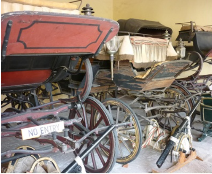
Véhicules hippomobiles relégués dans les musées (Jaipur, Inde, 2009)

hippomobiles, qui ont connu leur apogée en Europe et en Amérique du nord vers 1900 1 , et qui ont quasiment disparu en France dans les années 1930. Les voitures automobiles subiront-elles le même sort ?