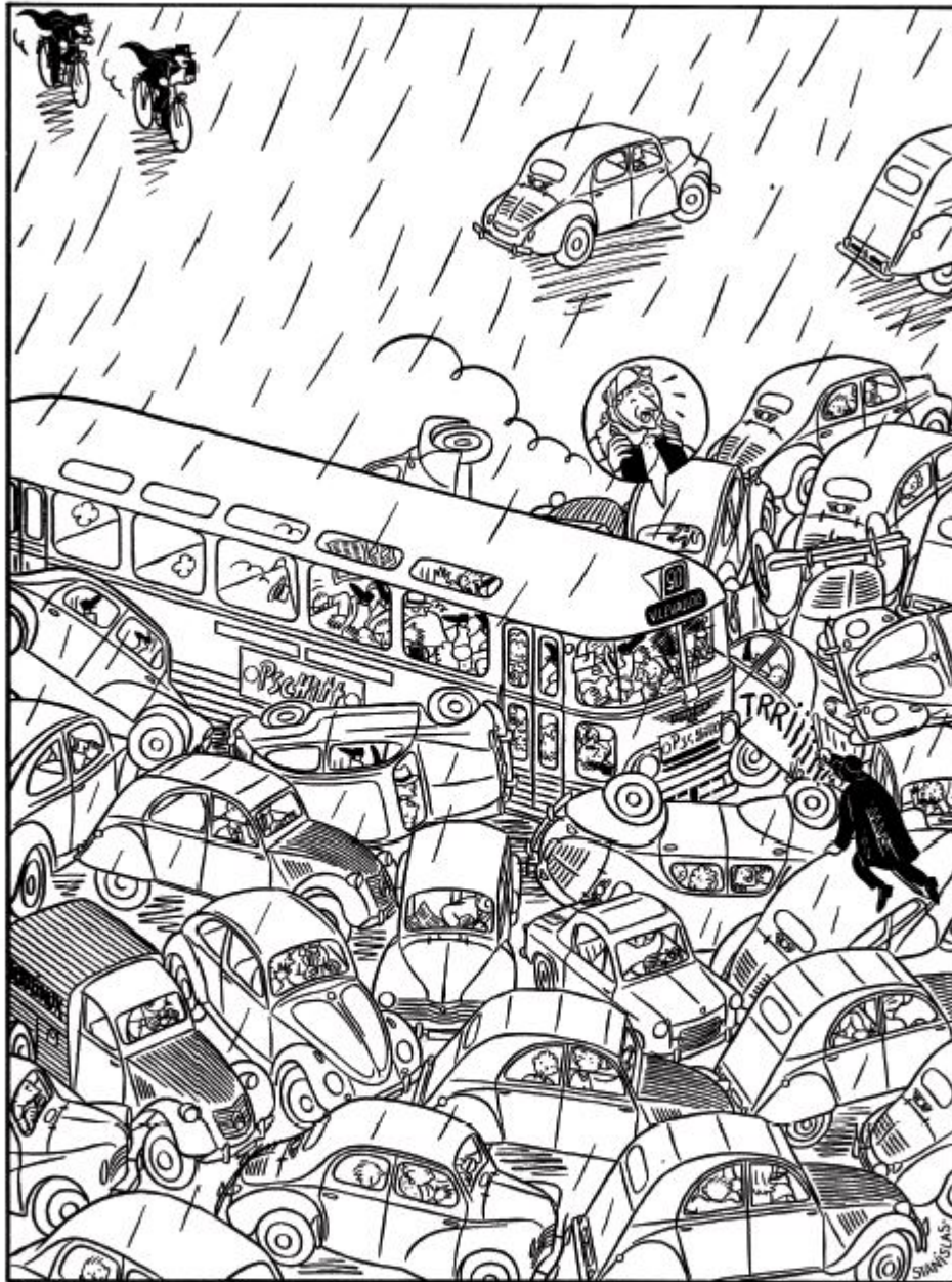
Extrait de l'ouvrage STANISLAS - ARCHIVES 1 de Stanislas © L'Association 2005 Avec l'aimable autorisation de l'auteur et des Editions L'Association

Christophe Gay, directeur du Forum Vies Mobiles : « L'expo reprend le fil de notre travail sur la transformation des modes de vie mobiles et les futurs possibles. La scénographie met en avant plusieurs problématiques : la vitesse, les migrations pendulaires, mais aussi les nuisances du quotidien, une aspiration au ralentissement. Nous avons cherché à illustrer ces grandes thématiques via des planches de BD, des toiles imprimées ou des