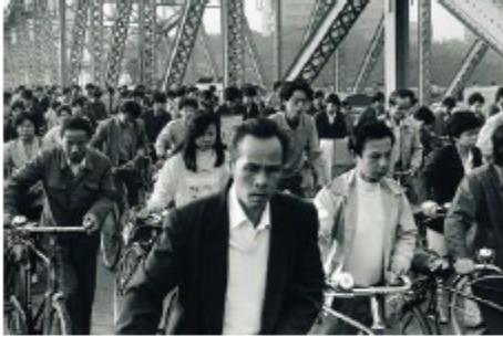
Collection Thomas Savéat. Série "Vivre à l'ère Deng Xiaoping", 2002, photographie © An Ge

En seulement 50 ans, la Chine a vu son système de mobilité bouleversé. Si on illustre généralement cette mutation en chiffres, le Forum Vies Mobiles a choisi une autre approche : aller à la rencontre des Chinois. Il les a interrogés sur les conséquences de ces transformations sur leur mode de vie. Il en ressort une image intime de la Chine contemporaine, entre fascination pour la modernité, nostalgie et inquiétude pour le futur. Un autre modèle de développement est-il envisageable ?